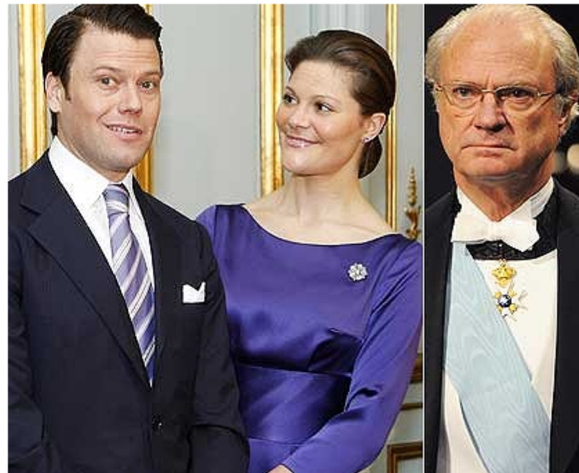
Fitness instructor Daniel Westling with his royal bride-to-be, Crown Princess Victoria, and her father King Carl XVI Gustaf.

“ The idea of the couple entering the church together symbolises that the man and the woman are entering the marriage of their own free will. In the future it is going to be very hard for us to resist requests from brides who want to be given away ”